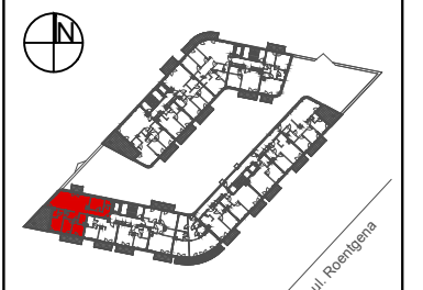
SCHEMAT - LOKALIZACJA MIESZKANIA

CAŁKOWITA POWIERZCHNIA UŻYTKOWA MIESZKANIA LICZONA JEST PO WEWNĘTRZNYM OBRYŚIE ŚCIAN (NIEROZBIERALNYCH) Z UWZGLĘDNIENIEM WARSTW TYNKOWYCH WEDŁUG NORMY PN-ISO9836:1997. POWIERZCHNIA POSZCZEGÓLNYCH POMIESZCZEŃ JEST LICZONA PO OBRYŚIE ŚCIAN JĄ OGRANICZAJĄCYCH Z UWZGLĘDNIENIEM WARSTW TYNKOWYCH. PODANE WYMIARY POMIESZCZEŃ NIE UWZGLĘDNIAJĄ WARSTW TYNKÓW I ZOSTAŁY ZWYMIAROWANE ZGODNIE Z NORMĄ DOTYCZĄCĄ WYMIARÓW. W BUDOWNICTWIE PN-B-01029:2000. ARANŻACJA LOKALU PRZEDSTAWIONA NA RZUCIE JEST PRZYKŁADOWA. UKŁAD ŚCIANEK DZIAŁOWYCH I SZACHTÓW MOŻE ULEC DROBNYM ZMIANOM NA ETAPIE REALIZACJI. LOKALIZACJA GNIAZD, PUNKTÓW ŚWIETLNYCH GRZEJNIKÓW I PRZYBORÓW SANITARNYCH ZOSTAŁA OZNACZONA SCHEMATYCZNIE I MOŻE ULEC DROBNYM PRZESUNIĘCIOM W TRAKCIE REALIZACJI