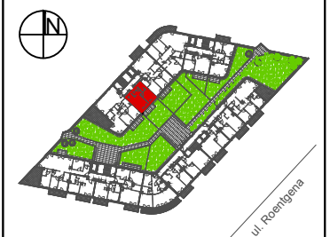
SCHEMAT - LOKALIZACJA MIESZKANIA

CAŁKOWITA POWIERZCHNIA UŻYTKOWA MIESZKANIA LICZONA JEST PO WEWNĘTRZNYM OBRYSIE ŚCIAN (NIEROZBIERALNYCH) Z UWZGLĘDNIENIEM WARSTW TYNKOWYCH WEDŁUG NORMY PN-ISO9836:1997. POWIERZCHNIA POSZCZEGÓLNYCH POMIESZCZEŃ JEST LICZONA PO OBRYSIE ŚCIAN JĄ OGRANICZAJĄCYCH Z UWZGLĘDNIENIEM WARSTW TYNKOWYCH. PODANE WYMIARY POMIESZCZEŃ NIE UWZGLĘDNIAJĄ WARSTW TYNKÓW I ZOSTAŁY ZWYMIAROWANE ZGODNIE Z NORMĄ DOTYCZĄCĄ WYMIARÓW. W BUDOWNICTWIE PN-B-01029:2000. ARANŻACJA LOKALU PRZEDSTAWIONA NA RZUCIE JEST PRZYKŁADOWA. UKŁAD ŚCIANEK DZIAŁOWYCH I SZACHTÓW MOŻE ULEC DROBNYM ZMIANOM NA ETAPIE REALIZACJI. LOKALIZACJA GNIAZD, PUNKTÓW ŚWIETLNYCH GRZEJNIKÓW I PRZYBORÓW SANITARNYCH ZOSTAŁA OZNACZONA SCHEMATYCZNIE I MOŻE ULEC DROBNYM PRZESUNIĘCIOM W TRAKCIE REALIZACJI