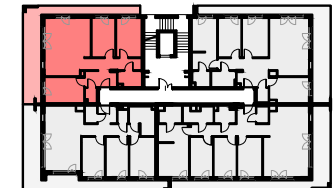
SCHEMAT - LOKALIZACJA MIESZKANIA

tel.: 22 436 84 30, 22 436 84 32, 601 212 273 e-mail: warszawa@yp.com.pl; www.yuniwersalpodlaski.pl